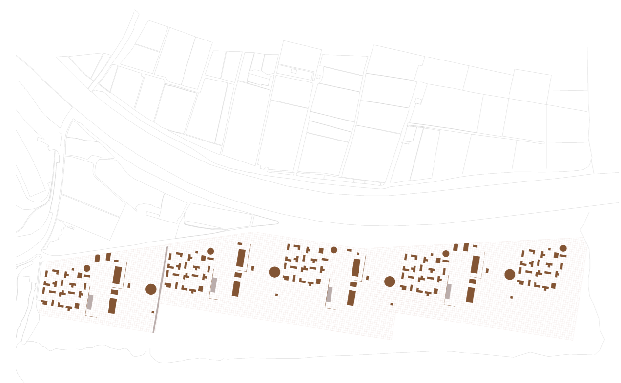
1. Desarrollo de la arquitectura con malla 3x3 m