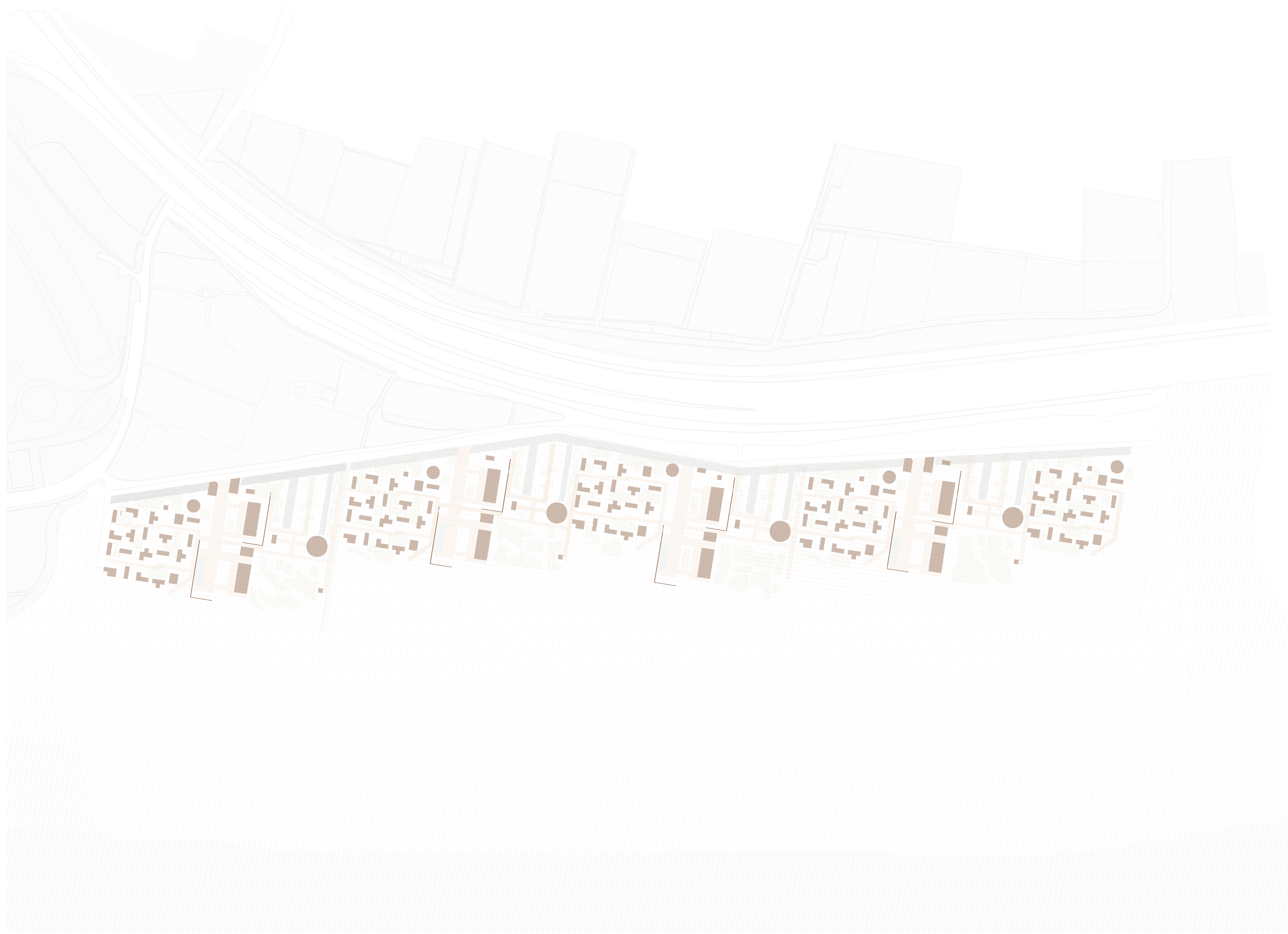
3. Propuesta ampliación 1/1.500